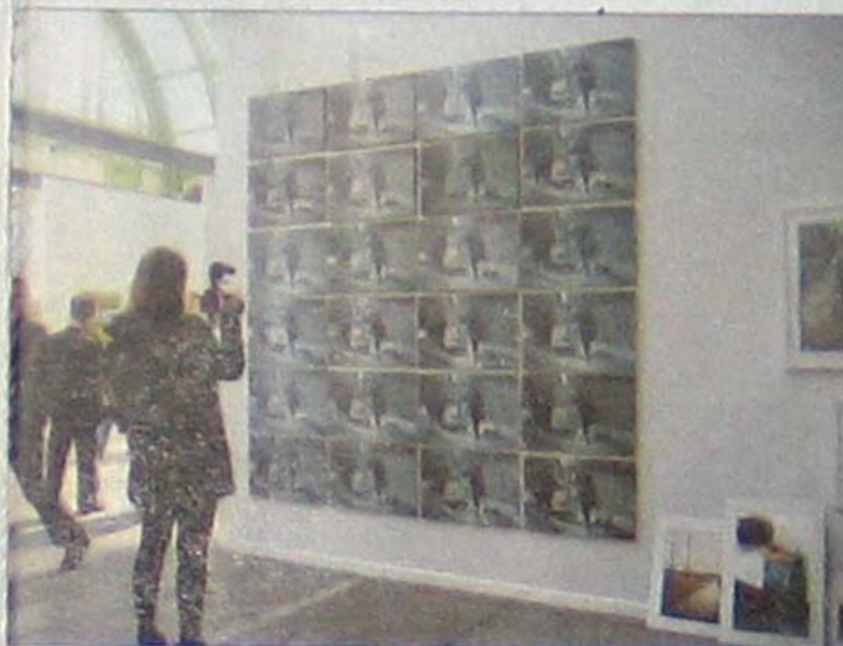
Kroz slikarski umjetnički izraz Radenka Milaka fotografija Rona Haviva

Poslije sedam godina djelovanja u Sarajevu, Galerija od deset kvadratnih metara, Duplex 10m2 koja je za taj period uspješno organizovati čak 180 izložbi,